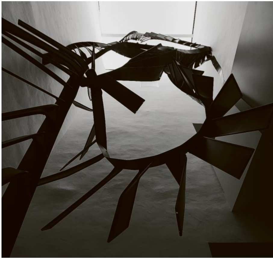
Die Installation der polnischen Künstlerin Monika Sosnowska